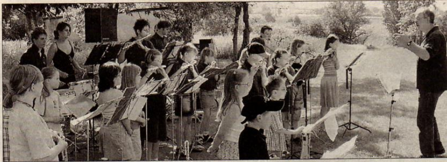
Hatten kaum geprobt, legten aber einen guten Auftritt hin in Oberwichterich: die jungen Musiker beim Nachwuchstag.